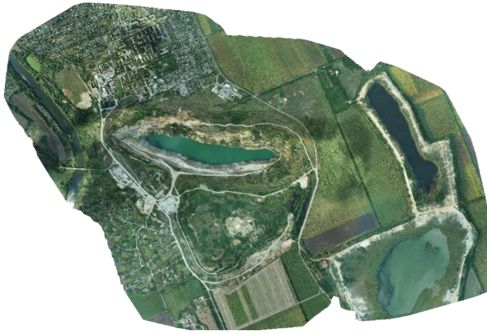
Рис.1. Ортофотоплан населеного пункту

Обробка результатів зйомки була виконана в програмі Pix4Dmapper, в системі координат USK-2000/Gauss-Kruger зона 6, масштаб зображень – 0,5. За результатами аерофотозйомки було створено ортофотоплан населеного пункту (рис.1).