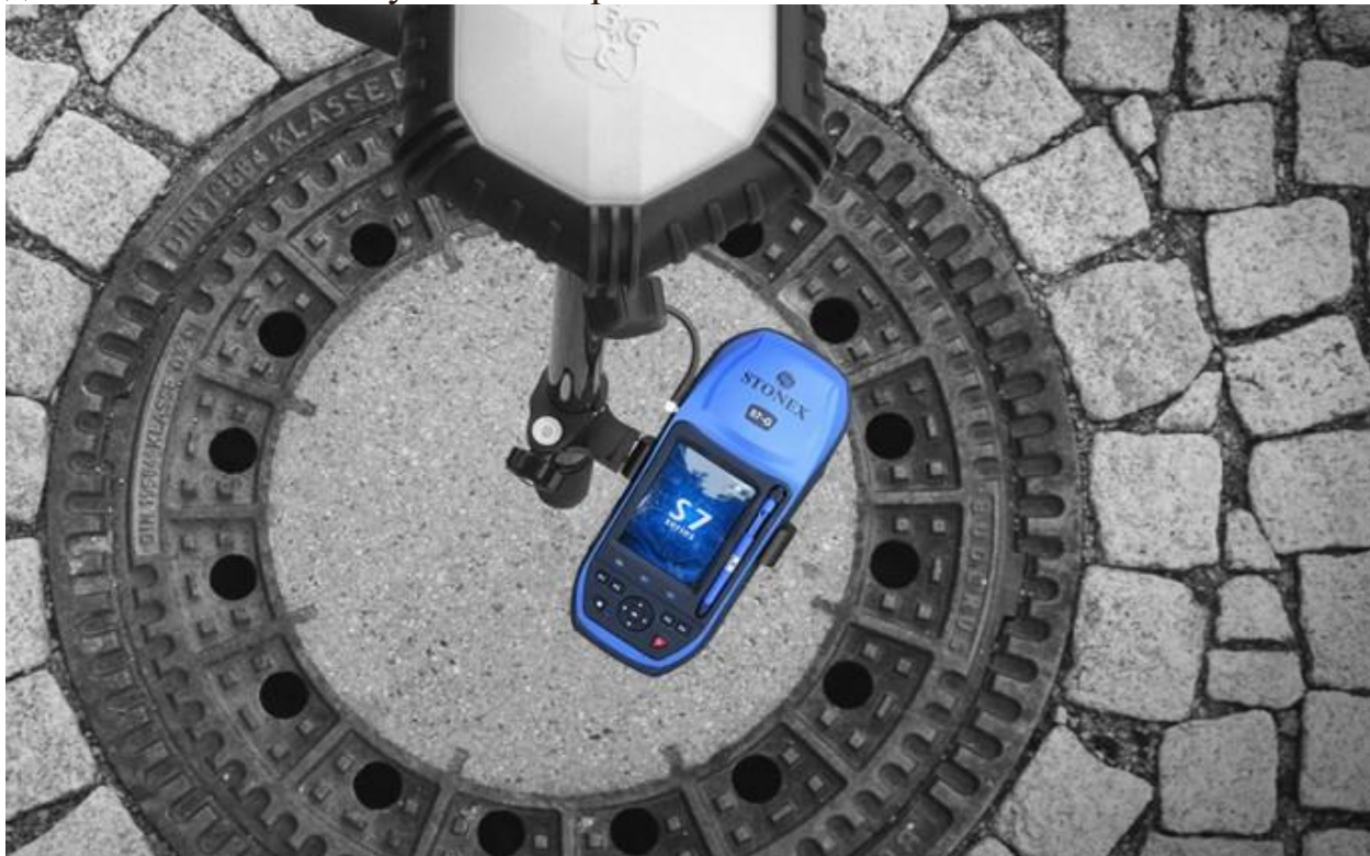
Рис. 1. Приймач STONEX S7-G

МП камеру, телефон та MMS, водо захищений USB вхід. У максимальній комплектації всі опції Li-Ion батарея великої ємності забезпечує понад 8 годин роботи. Картка пам'яті SD 16 Gb. Високопродуктивний сенсорний дисплей 3.7" забезпечує чітке зображення 640×480 пікселів.