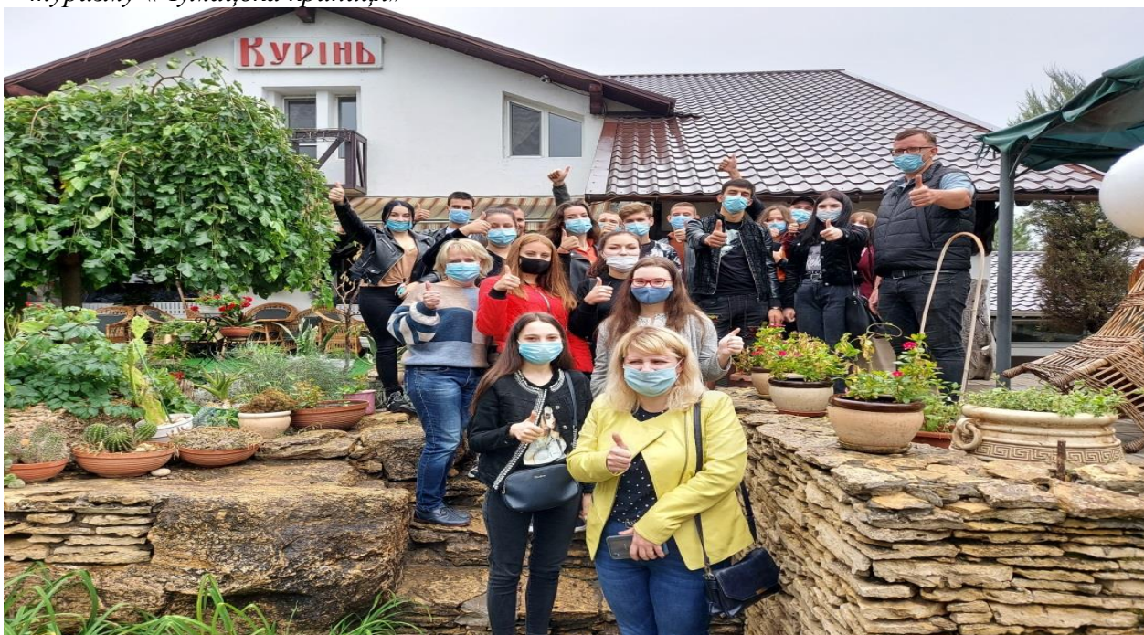
На фото: Виїзне заняття за темою: «Формування іміджу підприємства на внутрішньому ринку» на прикладі сімейної виноробні «Курінь»