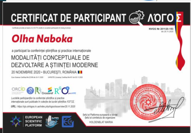
На фото: сертифікати, про участь НПП та здобувачів вищої освіти у міжнародних конференціях