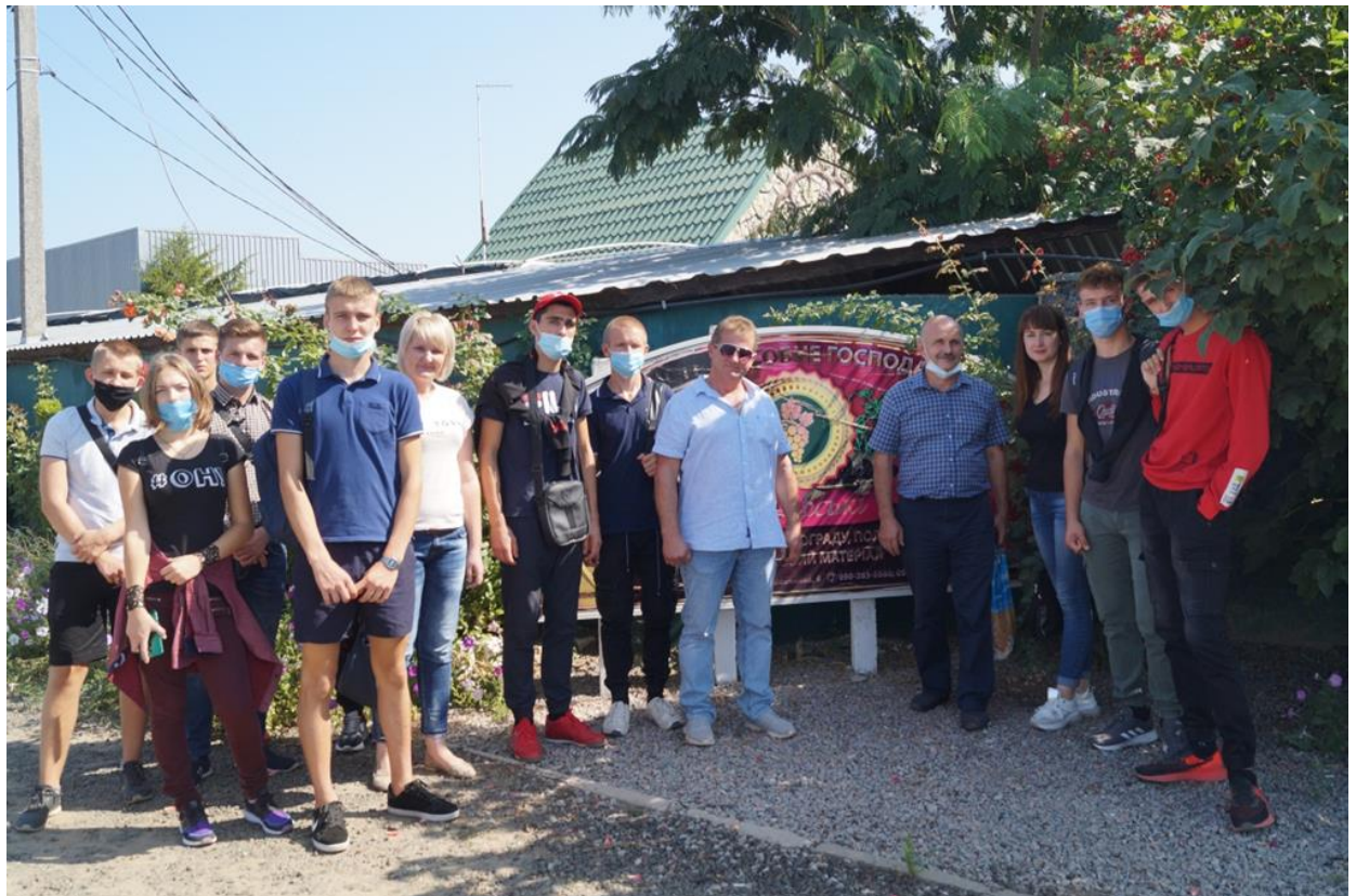
На фото: Виїзне заняття за темою: «Навчальна практика з плодівництва та виноградарства» на приватному підсобному господарстві «Павлівські»