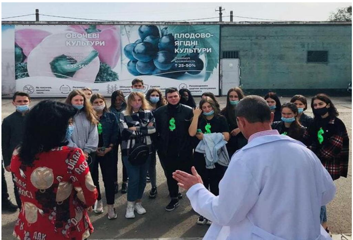
На фото: Виїзне заняття за темою: «Актуальні управлінські та інноваційні аспекти розвитку підприємства галузі плодоовочівництва» на НВП «5 ЕЛЕМЕНТ»