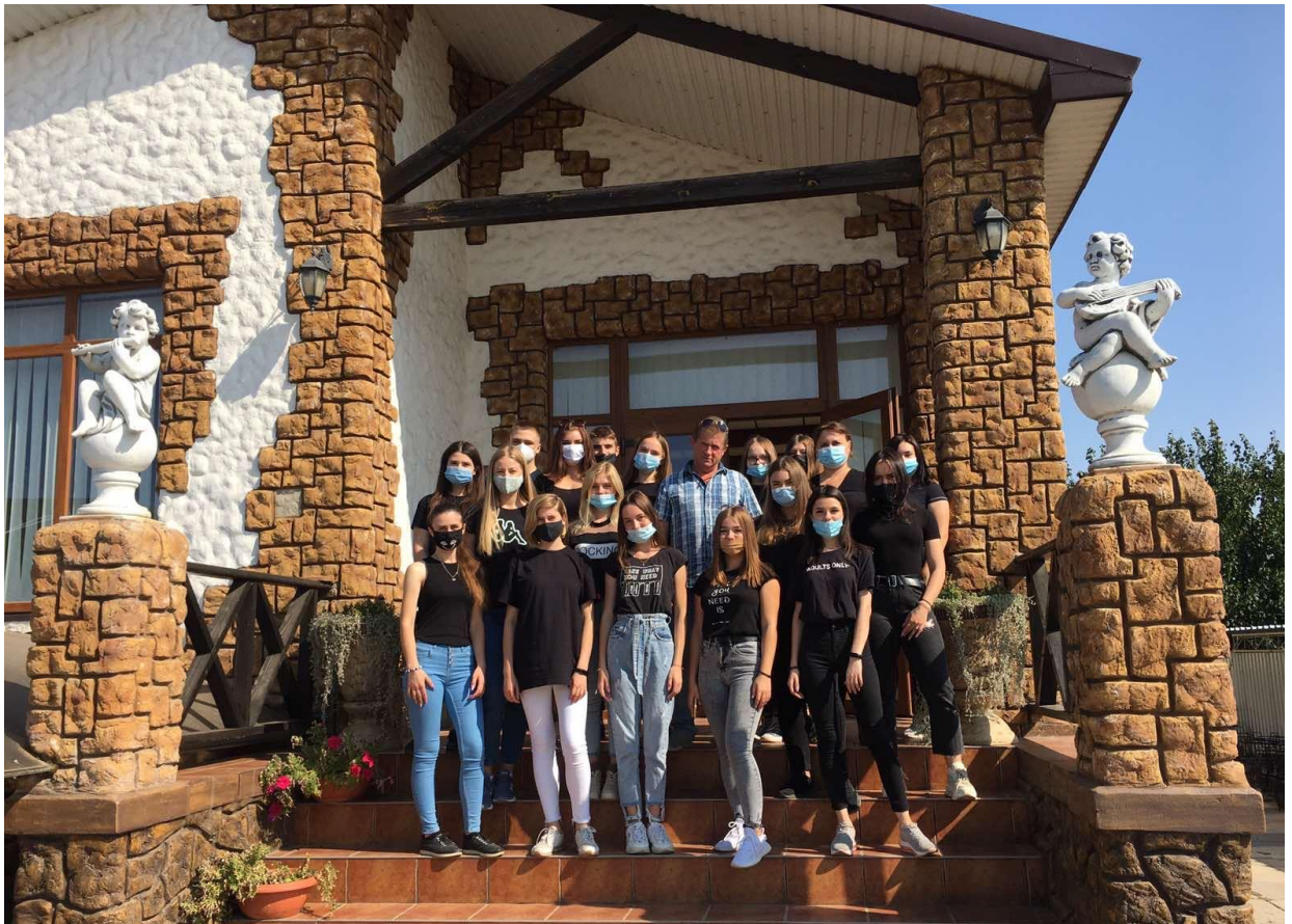
На фото: Виїзне заняття за темою: «Основи екскурсійної справи» на прикладі ОПГ «Павлівські»

У 2020 році Херсонський державний аграрно-економічний університет від проекту UNBDP отримав 470 тис. грн.