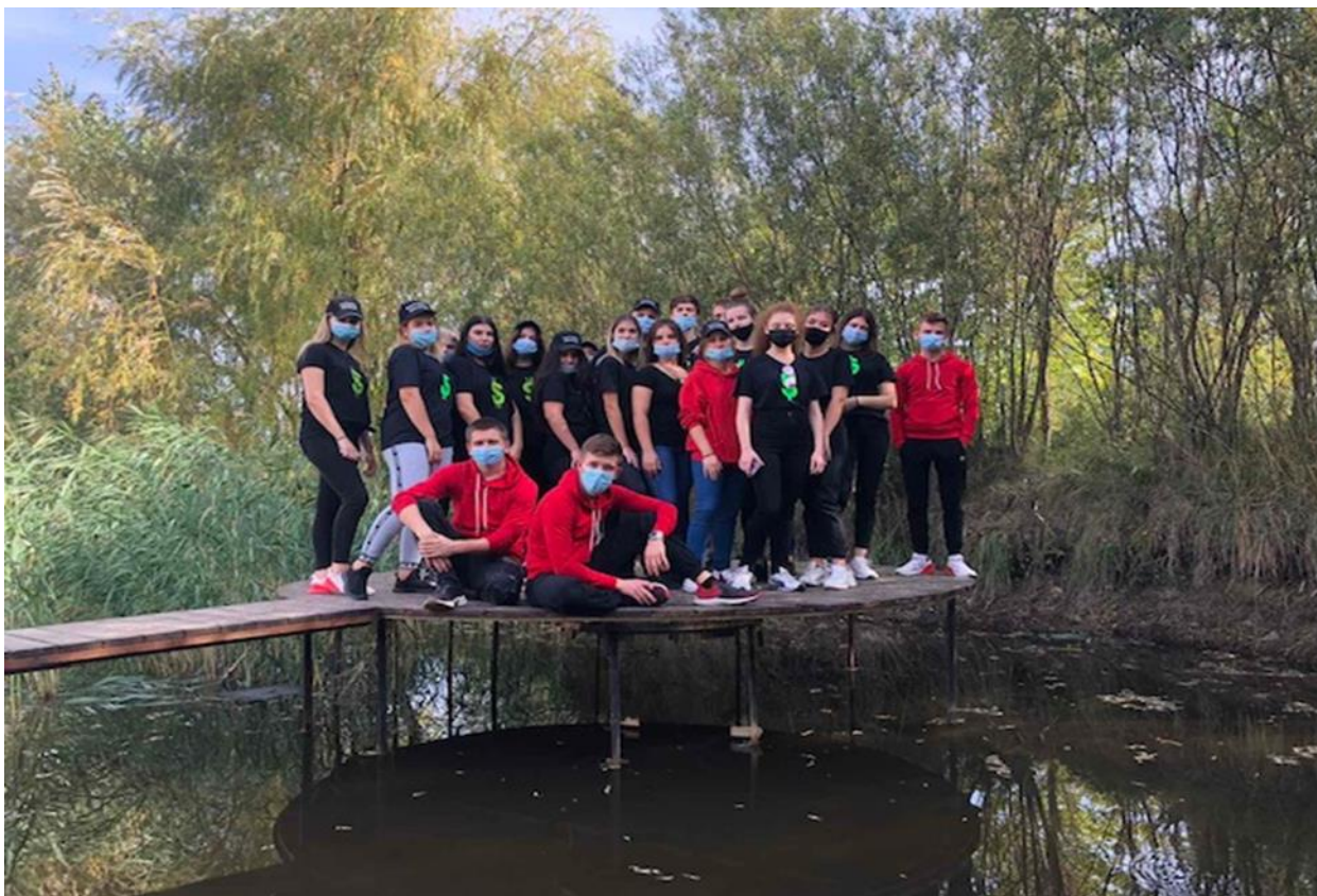
На фото: Виїзне заняття за темою: «Основні тенденції просування дестинації на туристському ринку з використанням еко-продукції плодоовочівництва» на базі зеленого туризму «Чумацька криниця»