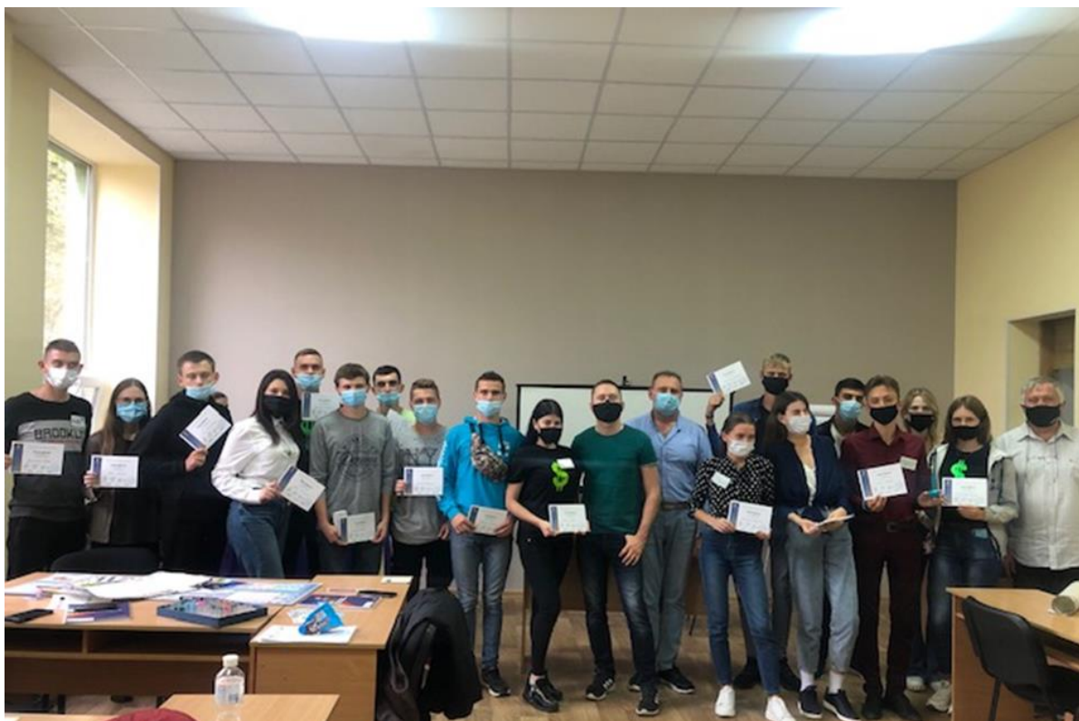
На фото: Фінал бізнес-тренінгу «Системний погляд на агробізнес»

Тільки у 2020 році проєкт UHBDP профінансував 5 виїзних занять, 4 круглих столів, ділову гру «Freshbiz» та бізнес-тренінг «Системний погляд на агробізнес».