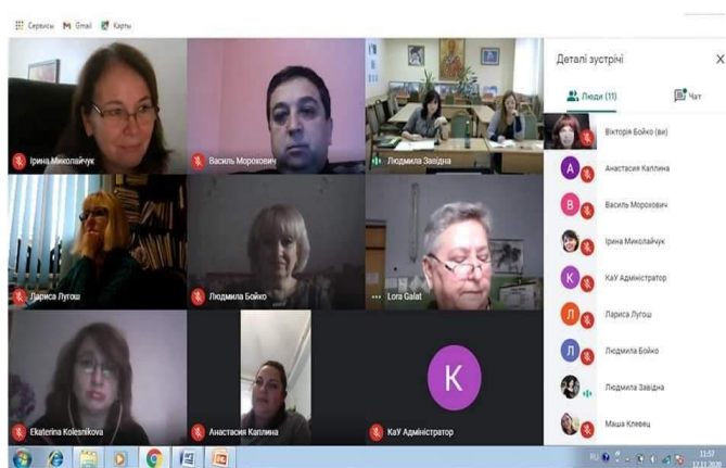
На фото: участь НПП та здобувачів вищої освіти у міжнародних конференціях