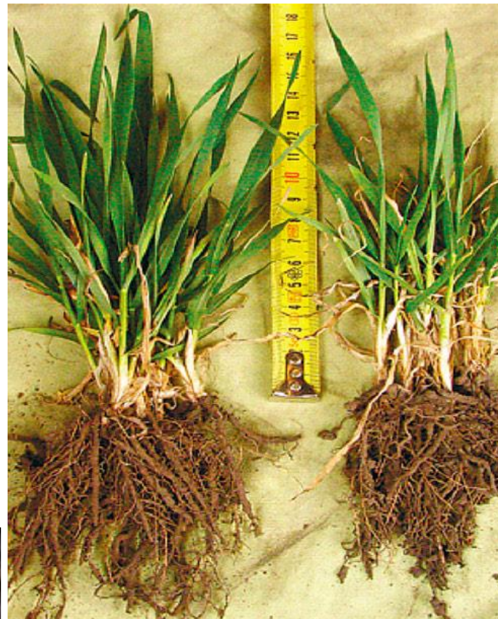
ФОТО. Розвиток рослин без обробки та з обробкою біопрепаратом (варіант 6 та варіант 4)