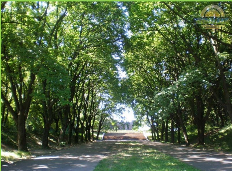
Стрийський парк у Львові – типовий представник середньовічних парків.