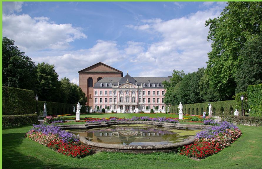
Парк і палац в місті Трір (Нмеччина) – представник парків доби бароко.