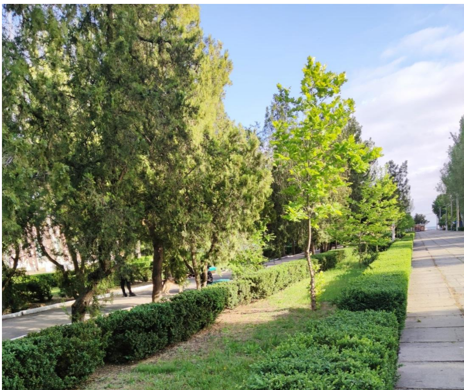
Рисунок 2. Оновлення алеї «Закоханих», місто Скадовськ.

Формування сучасної структури дендрофлори Скадовська почалося з центральної частини міста і відбувалося у кілька етапів у східному та західному напрямках і більшість наявних дерев і кущів зеленої зони міста були висаджені у 70-80-ті роки ХХ століття [1,2].