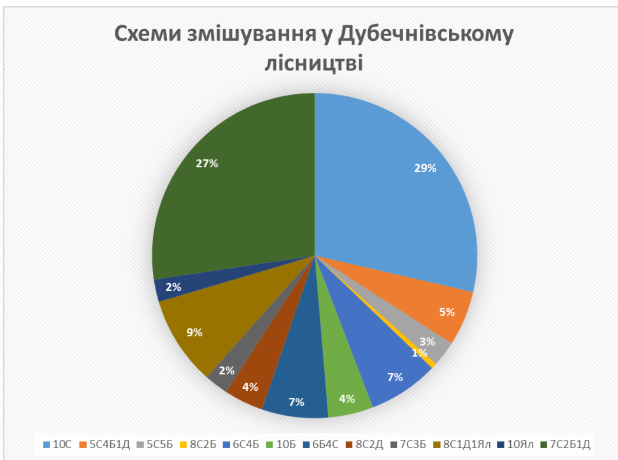
Рис. 1. Розподіл лісокультурного фонду за схемами змішування

Біологічна стійкість та продуктивність лісових насаджень залежить від складу та схеми змішування лісових рослин, при цьому враховують дендрологічні ознаки порід. При створенні лісових культур перевагу слід віддавати змішаним насадженням. Змішані культури підвищують водоохоронно-захисну роль деревостану, сприяють поліпшенню структури ґрунту, швидкому переведенню поверхневого стоку у внутрішній, краще закріплюють ґрунт на крутих схилах. Проте у певних умовах місцезростання можна вирощувати й чисті деревостани. Це насамперед стосується чистих соснових культур на дуже бідних і сухих ґрунтах, чорновільхових у вільховій трясовині [1].