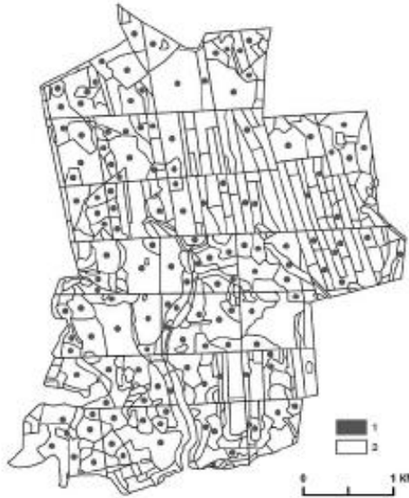
Рис. 1 Схема розташування точок дослідження на території лісового масиву Дрібний Ліс: 1 - точки оцінки параметрів насаджень і їх спектральних властивостей, 2 - контури лісотаксаційних виділів

Для виправлення помилки НС застосований метод найменших квадратів: